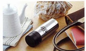
倒れてもこぼれません。